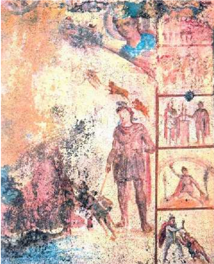
Escebas de la cosmogonia y otras imagens del ciclo de la vida de Mitra, siglo III, "Mithraeum" Barbeni, Roma, pintura mural. En estos dos ejemplos, ambos provenientes de diferentes ámbitos y realizados en diferentes siglos, se puede observar el uso de la túnica corta, los pantalones anaxyrides y el gorro frigio de los persas.

Las representaciones tardorromanas de la Epifanía muestran visitas pomposas, al estilo de los cortejos diplomáticos. No hay postración porque el énfasis no está puesto en el acto de la adoración sino en la entrega de los presentes.