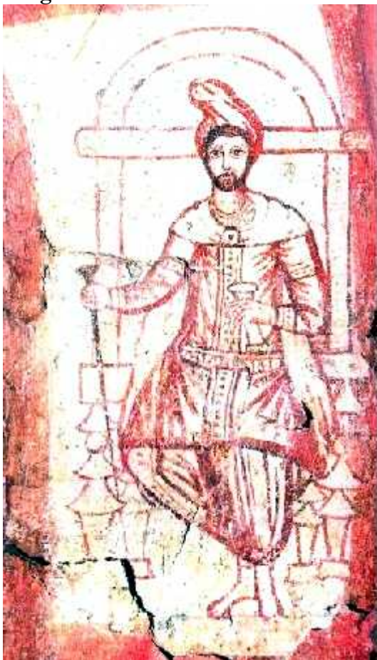
Probable retrato de Zoroastro - Dura europos, siglo II, pintura mural en la University art gallery de Yale, arte sirio pagano.